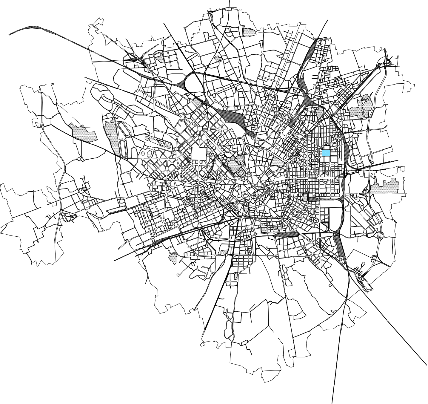
Planimetria Comune di Milano