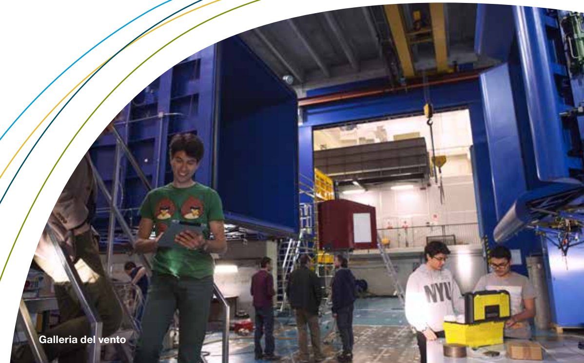
Galleria del vento

A schedule of events and testimonies of success stories organised precisely for startups, along with access to a number of conferences and other initiatives organised by Politecnico di Milano and its consortia. Such occasions provide an abundance of technological foresight and business opportunities for your company, especially to network .